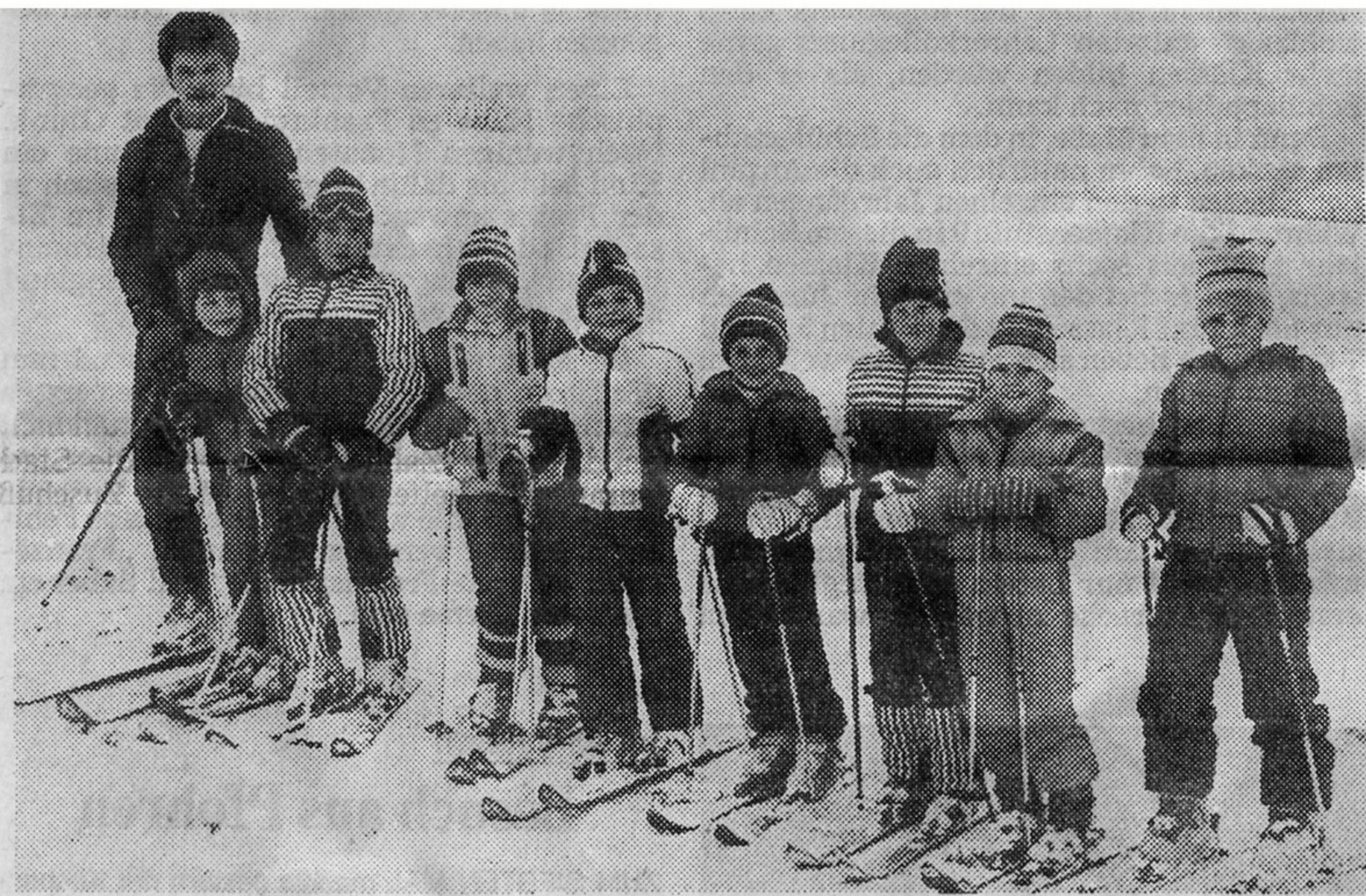
90 KINDER aus Donaueschingen und Umgebung haben in den vergangenen Tagen an den Skikursen des SC Baar teilgenommen. An drei halben und einem ganzen Tag wurden sie mit zwei Bussen in das Gebiet der Kalten Herberge gebracht, wo die Schneelage für Kinderskikurse zufriedenstellend war. Beim Abschlußrennen wurde das Erlernete erprobt. Eine Urkunde bestätigt jedem Teilnehmer seinen Erfolg. Südkurier 05.01.1985