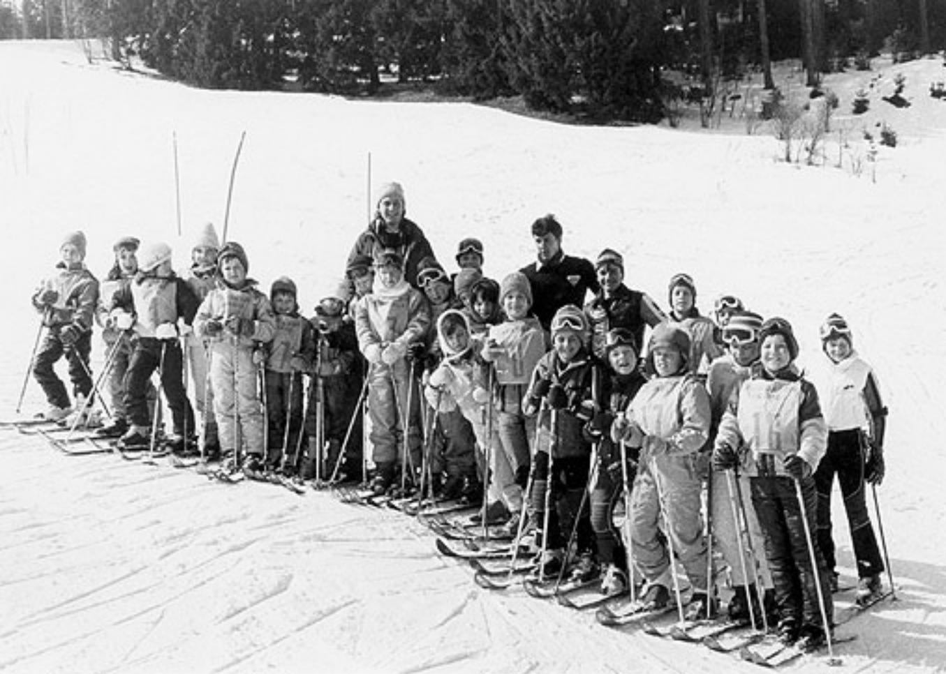
Nachwuchssportmannschaft im März 85 nach dem Saisonabschlussrennen in Eisenbach