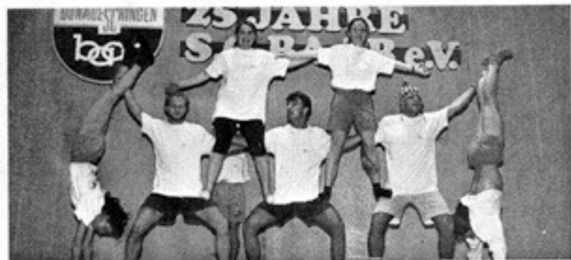
Spaß und Sport verbanden Aktive des „Ski-Clubs Baar“ bei der Jubiläumsfeier aus Anlaß des 25-jährigen Bestehens ihres Vereins im „Sternensaal“ in Donaueschingen.