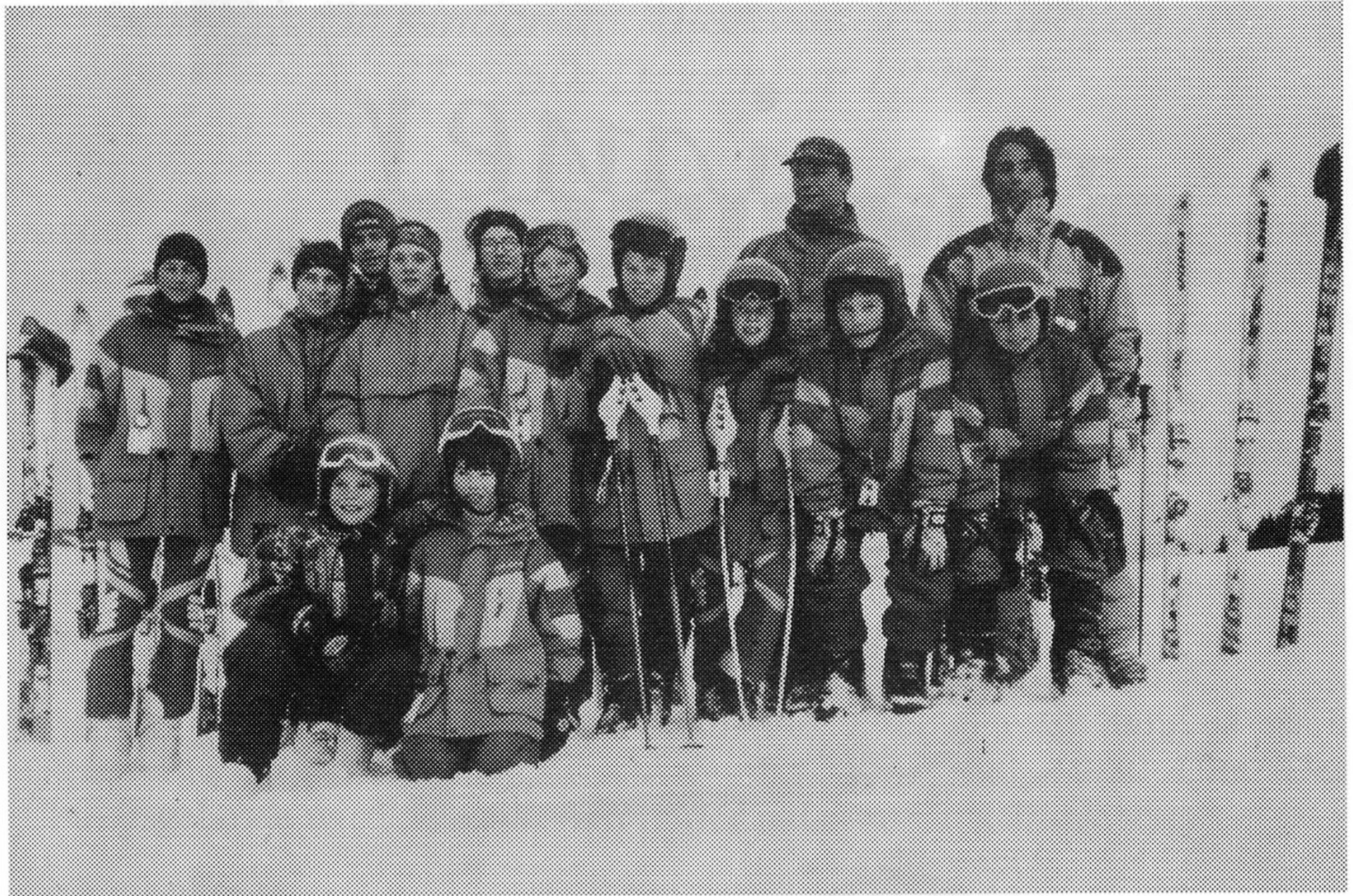
Die Sportmannschaft des SC Baar im Trainingslager Beckenried 1996!