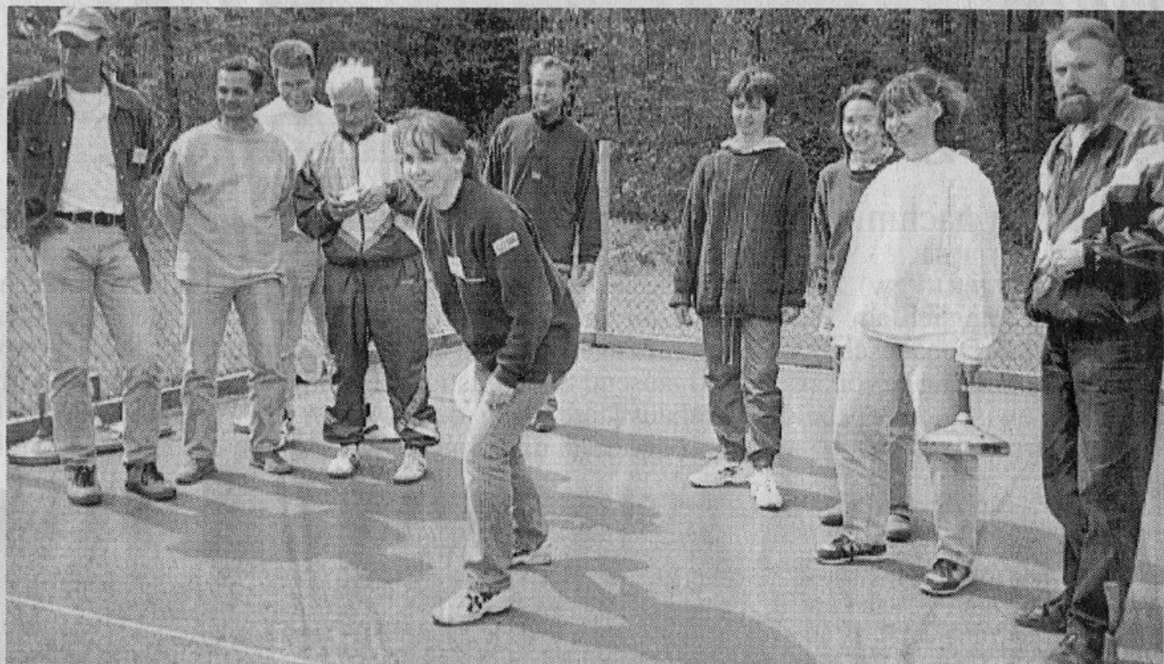
Die Damen und Mädchen vom SC Baar, der Kegelclub von Aufen und andere Donaueschinger griffen am Wochenende im Donaueschinger Park zum Eisstock. Beim internationalen Turnier am Samstag ging's hoch her, beim Grümpeltturnier am Sonntag war Gaudi angesagt.