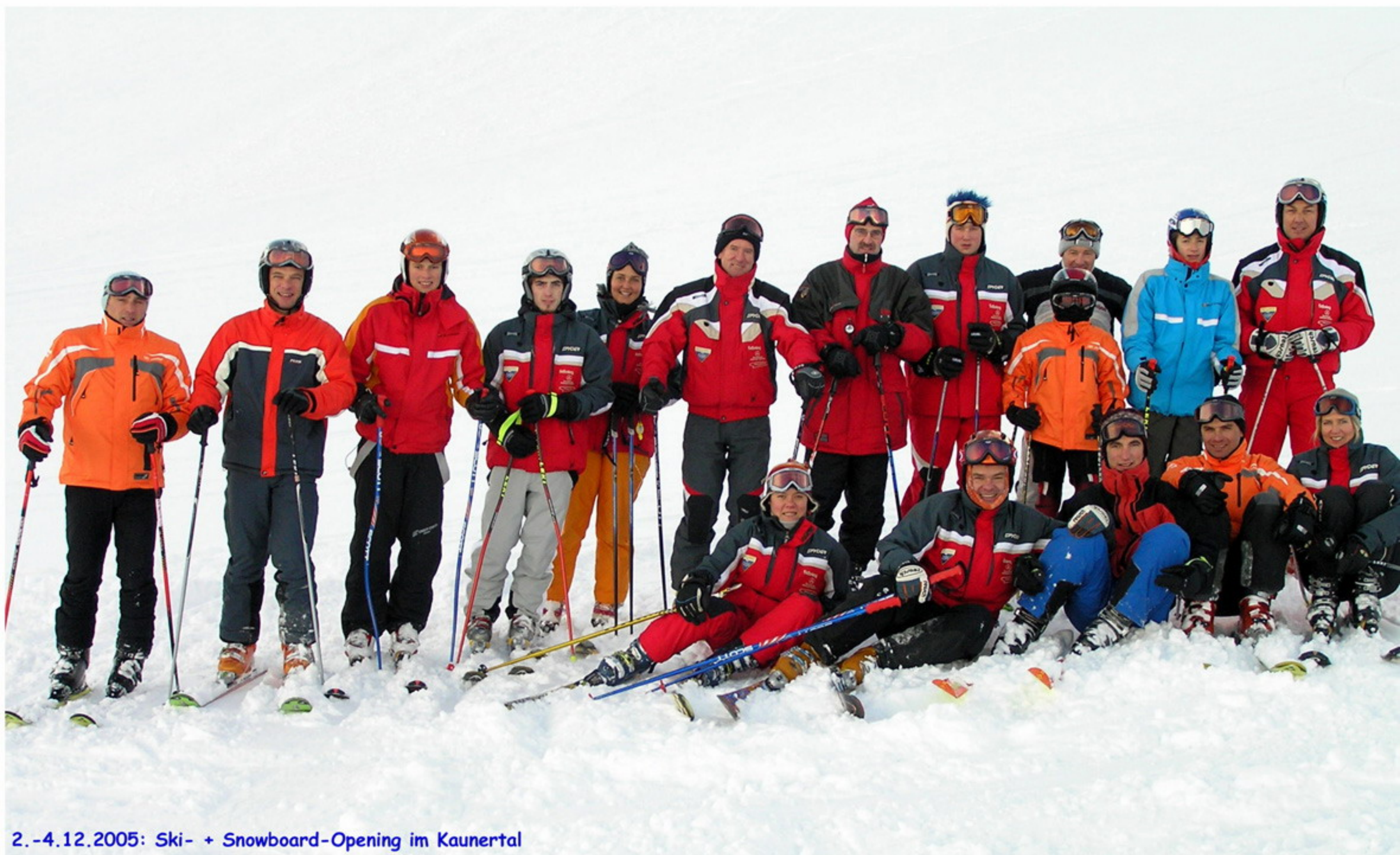
2.-4.12.2005: Ski- + Snowboard-Opening im Kautertal