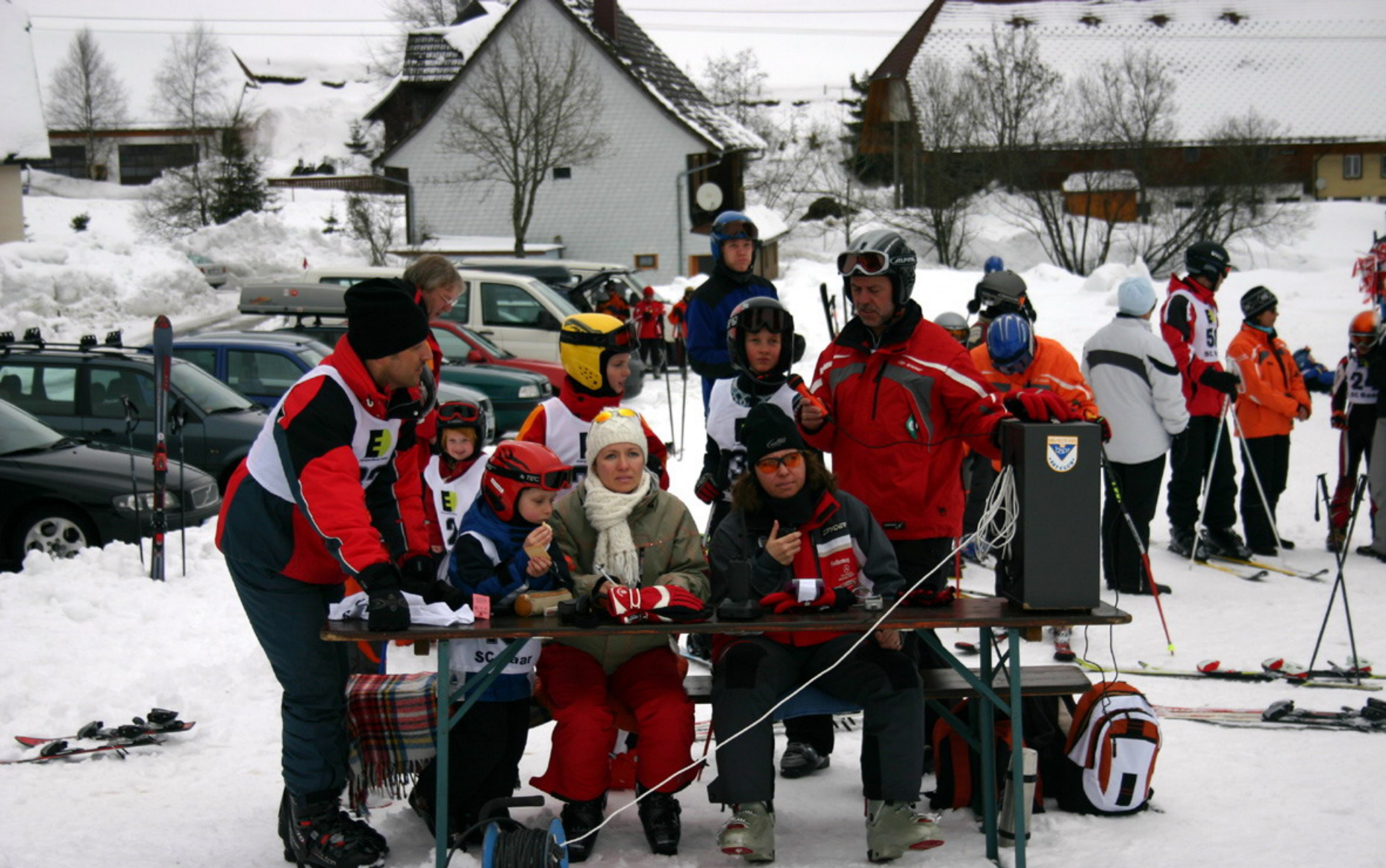
19.02.2006: Vereinsmeisterschaften am "Sägenhof", Urach