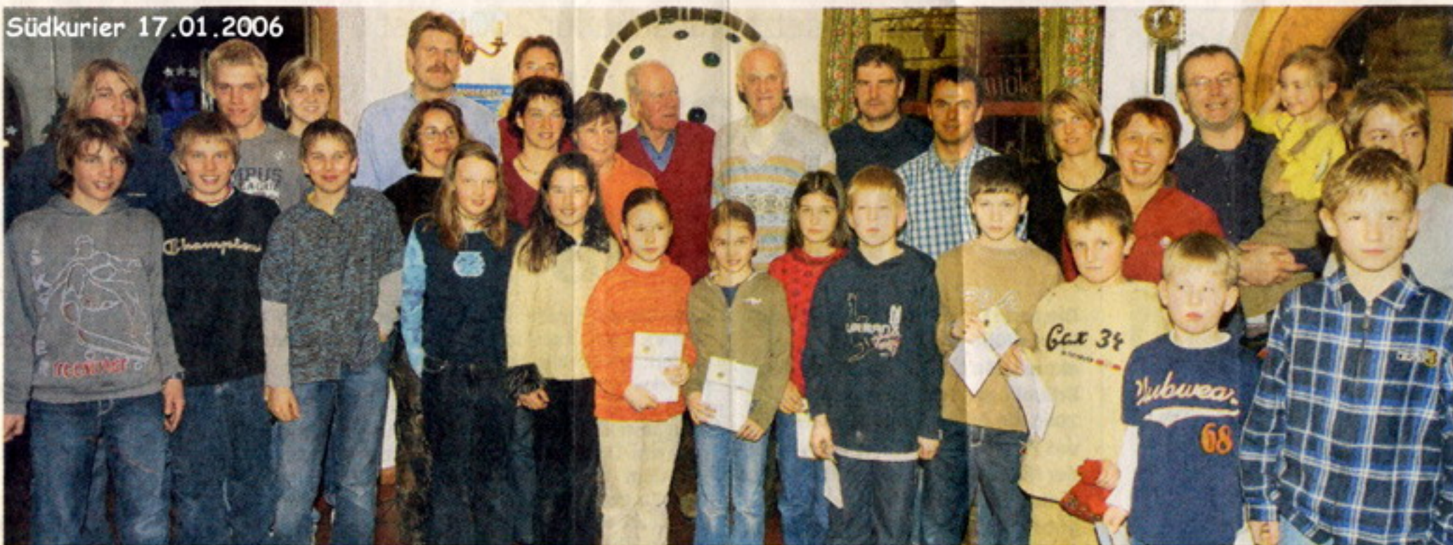
Enorm in Form: Diese Donaueschinger dokumentieren mit dem Sportabzeichen ihre Fitness.