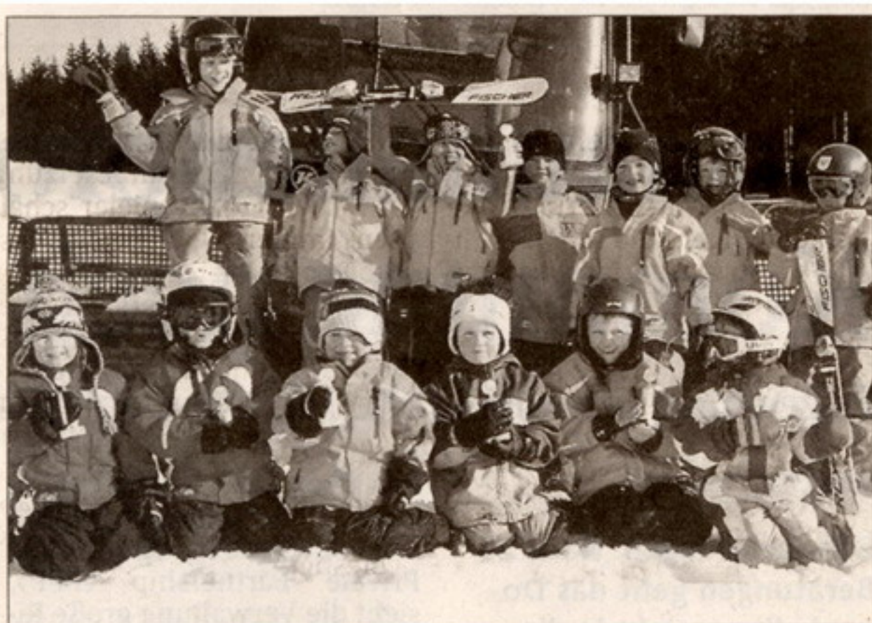
Eine gute Figur machten die Nachwuchsrennläufer des SC Baar beim SCE-Cup.