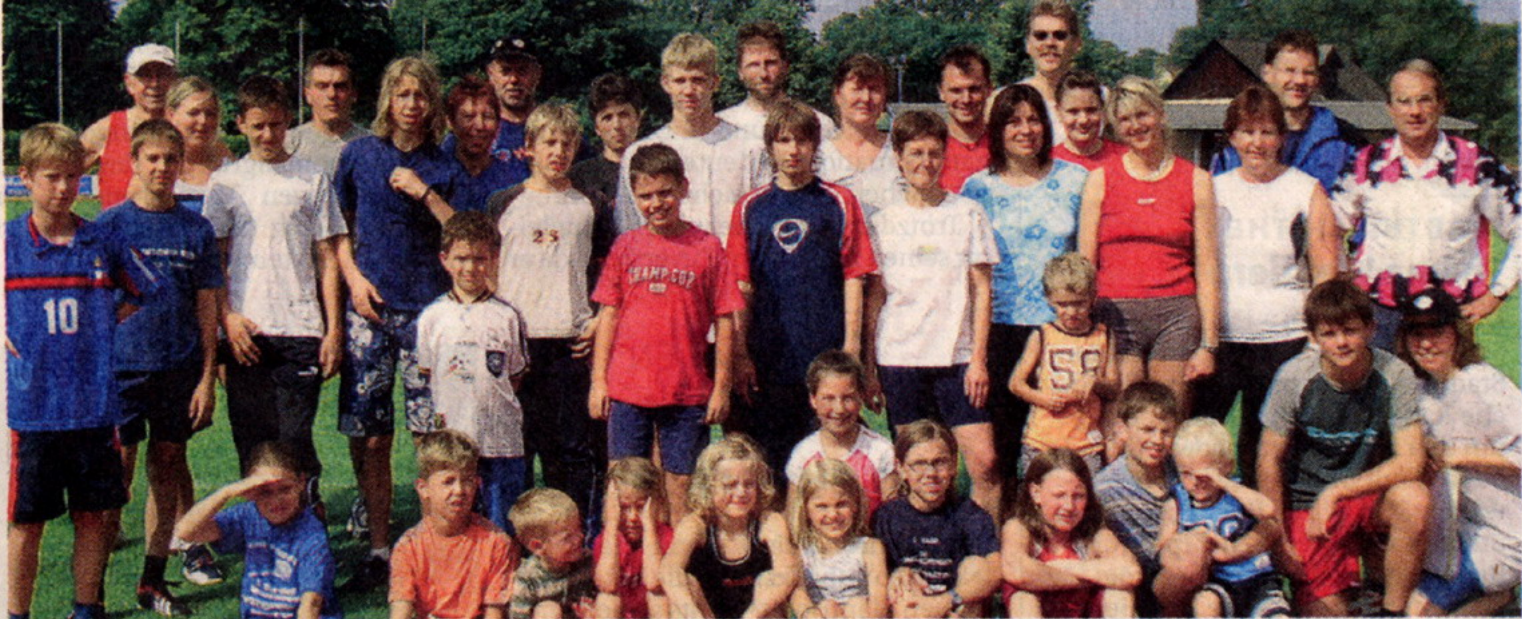
Die Gruppe vom SC Baar war glücklich über ihr bestandenes Sportabzeichen.