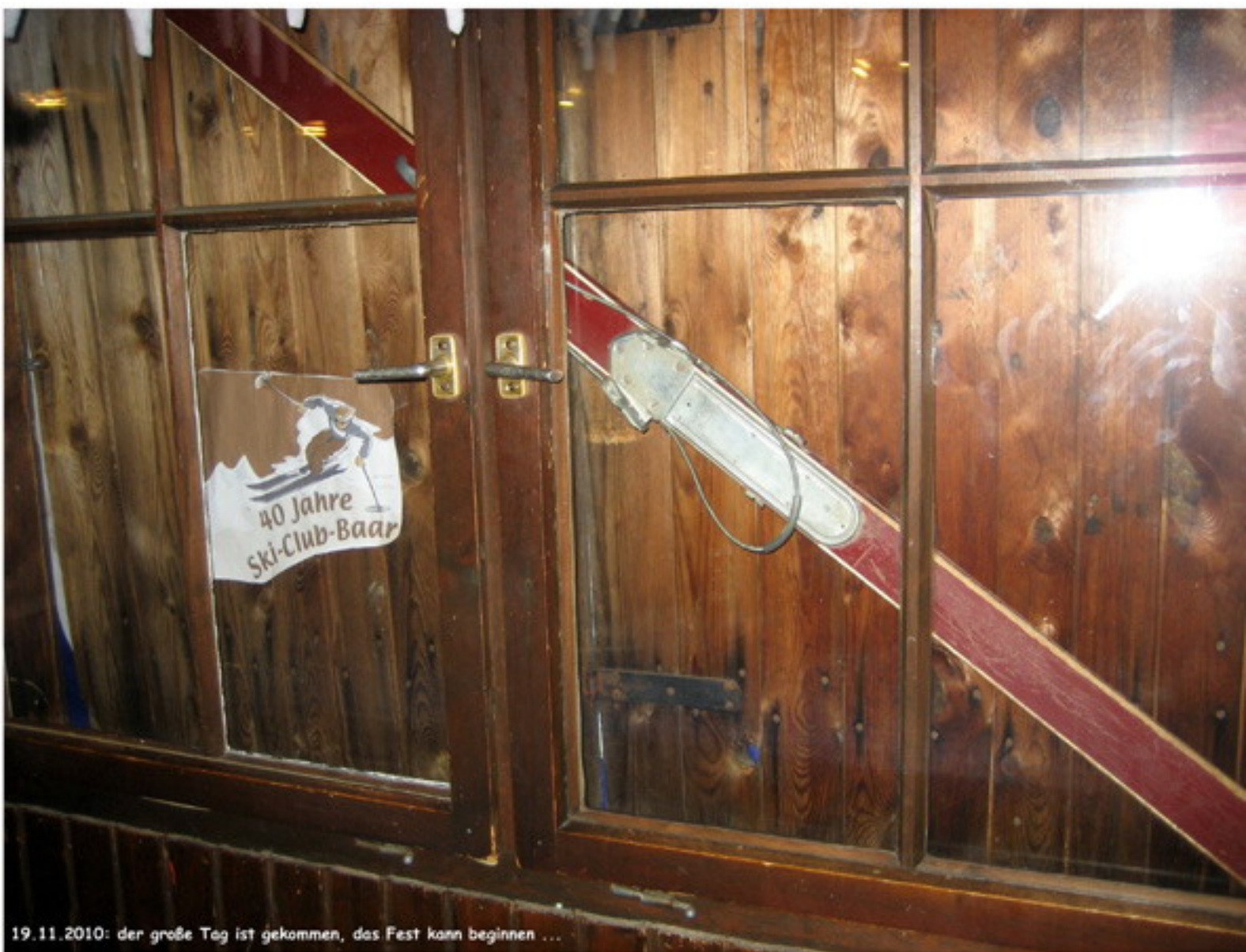
19.11.2010: der große Tag ist gekommen, das Fest kann beginnen ...