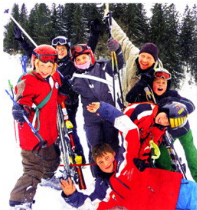
Viel Spaß haben die Teilnehmer bei den Kursen des Ski-Clubs Baar.