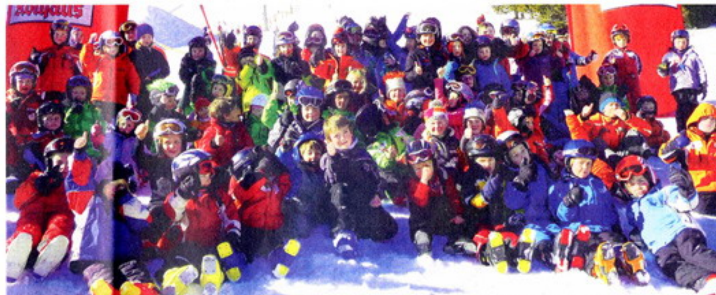
Beim Bambini-Rennen des Skibebezirks drei auf dem Feldberg herrschte bei der Siegerehrung eine großartige Stimmung. Alle Kinder erhielten Pokale und Urkunden.

Bei besten Pistenverhältnissen und herrlichem Sonnenschein wurde ein kindgerechter Riesenslalom mit zwei Durchgängen ausgefahren. Wer von den Mädchen und Buben im Alter von vier bis neun Jahren im ersten Lauf den Parcours schlecht gemeistert hatte oder wegen Torfehler keine Wertung bekam, musste nicht traurig sein, denn der zweite Lauf eröffnete eine weitere Chance zu einem besseren Ergebnis.