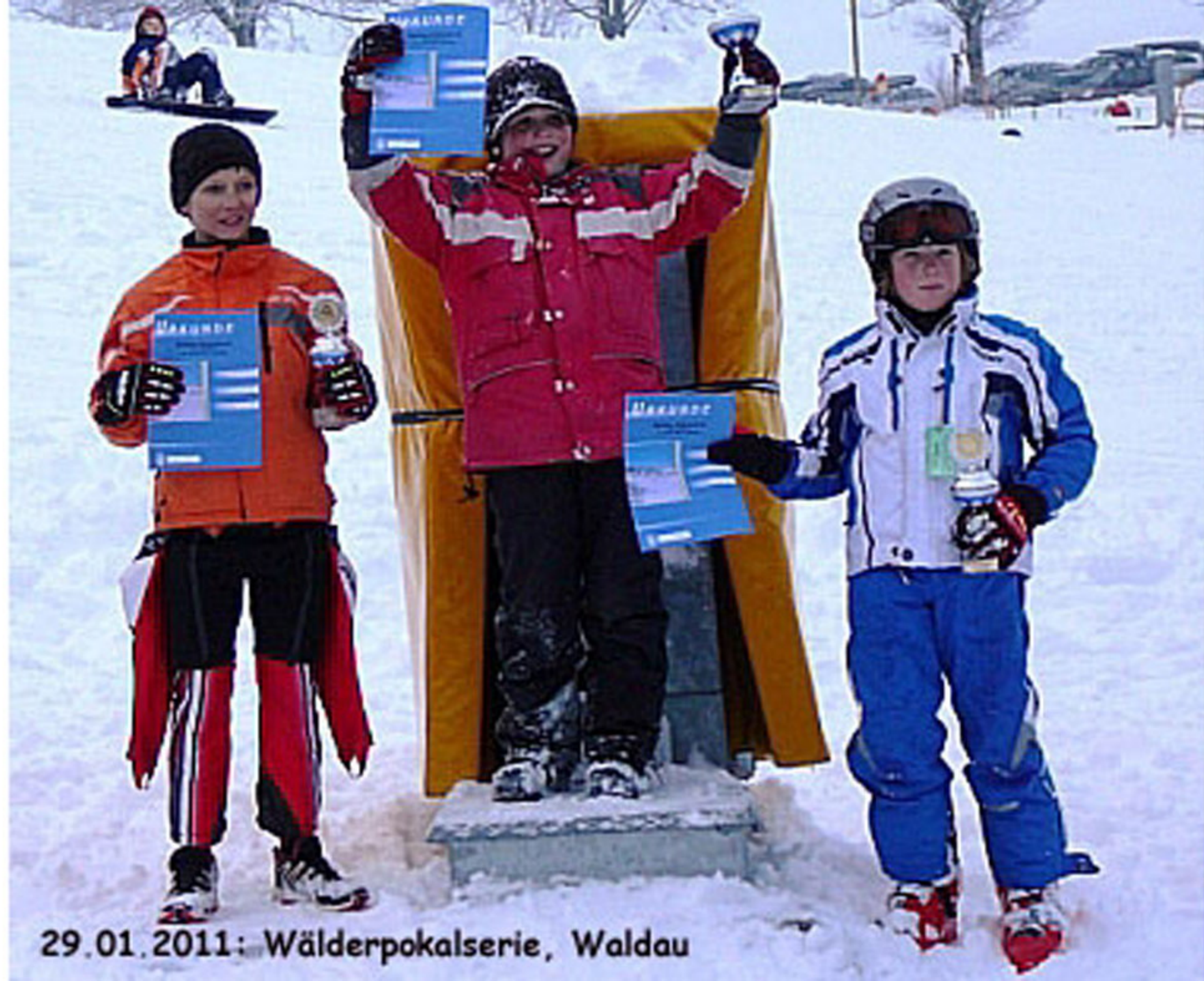
29.01.2011: Wälderpokalserie, Waldau