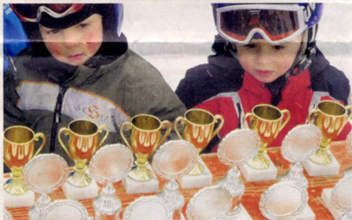
Jung und schon ein bisschen ehrgeizig: Jedes Kind erhält nach dem Rennen einen Pokal.

Außerdem richtet der Ski-Club am Samstag, 5. Februar, 10 Uhr, ein Bezirkspunkterennen für den Ski-Bezirk