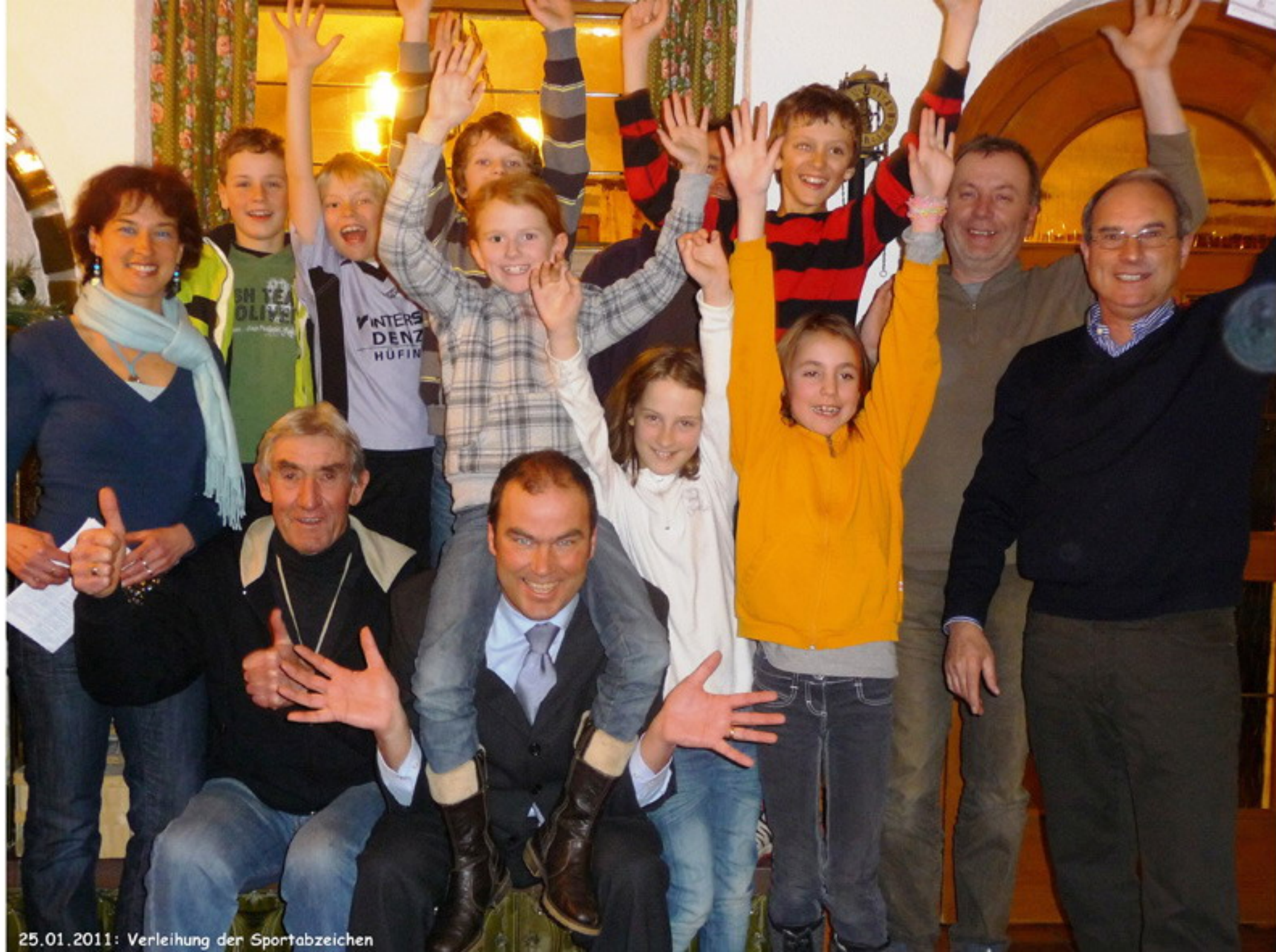
25.01.2011: Verleihung der Sportabzeichen