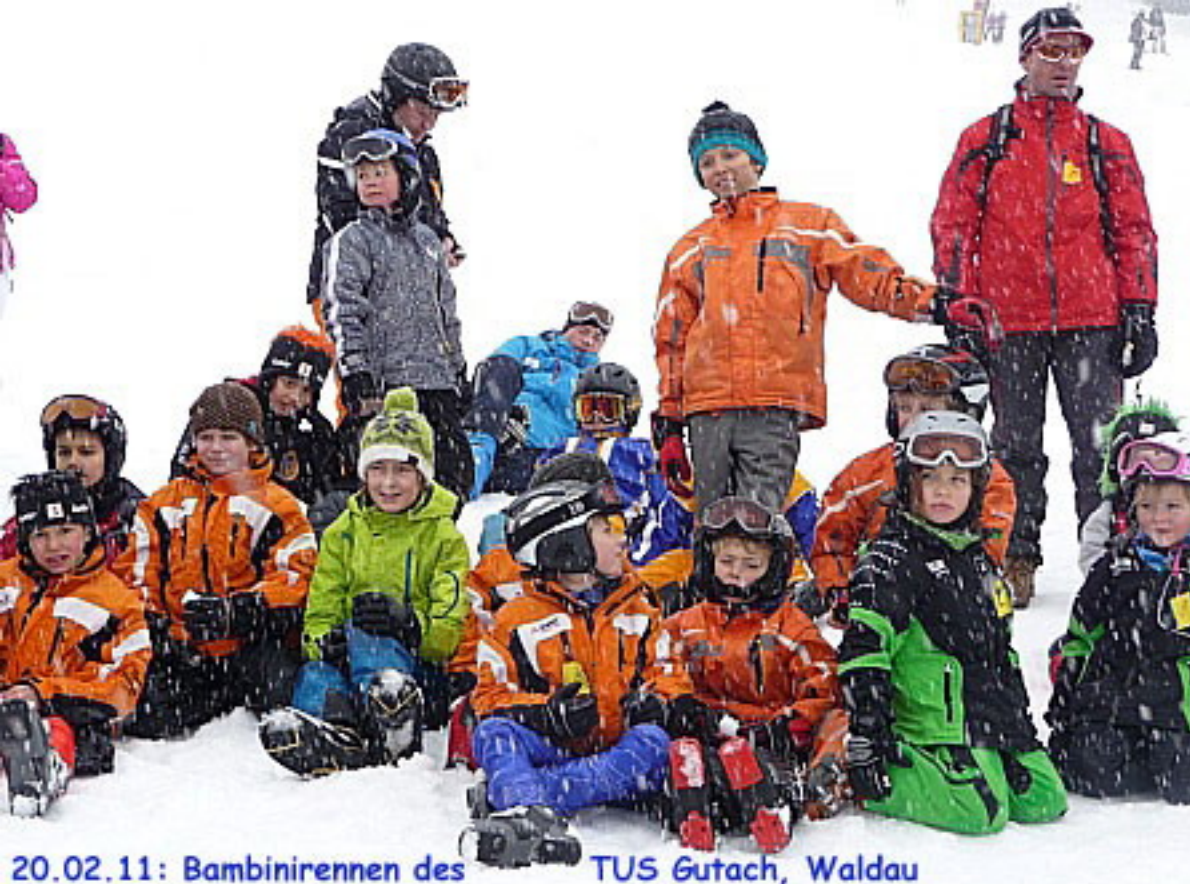
20.02.11: Bambinirennen des TUS Gutach, Waldau