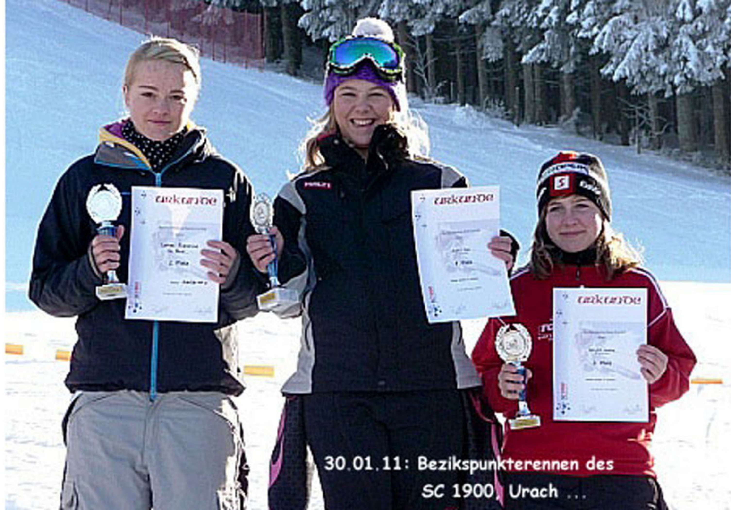
30.01.11: Bezikspunkterennen des SC 1900, Urach ...