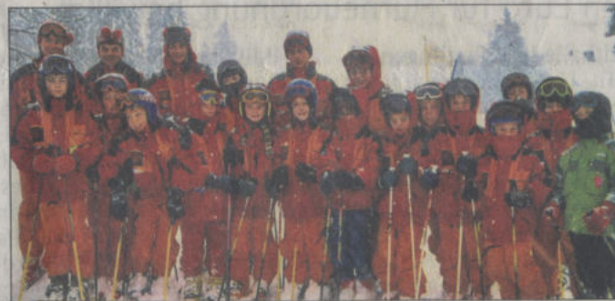
Erfolgreiche Kurse sind ein Markenzeichen des SC Baar. Hier ein Skikurs 1999 am Feldberg.