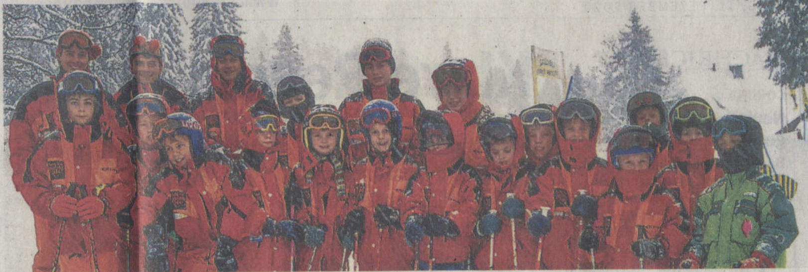
Erfolgreiche Kurse sind ein Markenzeichen des SC Baar. Hier ein Skikurs 1999 am Feldberg.

Vor Gründung des SC Baar war der SC 1900 Monopolist in punkto Skifahren. Dieser war eine Unterabteilung der Sportvereinigung Donaueschingen. Zahlreiche Übungsleiter mit unermüdlichem Einsatz für Kinder, Jugendliche und Erwachsene verhalfen dem SC 1900 auch zu beträchtlichen Einnahmen in den damals noch schneesicheren Wintermonaten. Die Übungsleiter selber hingegen lebten das Ehrenamt pur und konnten mit den Vergütungen seitens des Clubs ihre eigenen Ausgaben kaum selber decken. Dennoch sah